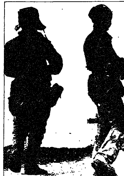
دورية سوفياتية على طريق جبلي منزول بالقرب من العاصمة الأفغانية كابل

بين الصين والولايات المتحدة ، الذي تشمل وودوا بتقديم مسون عسكري